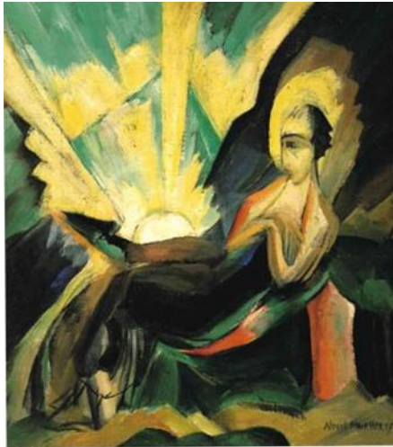
Albert Mueller. Sonnenaufgang, 1917. Sammlung Hermann-Josef Bunte.

Sonderausstellung / Hölle & Paradies. Der deutsche Expressionismus um 1918.